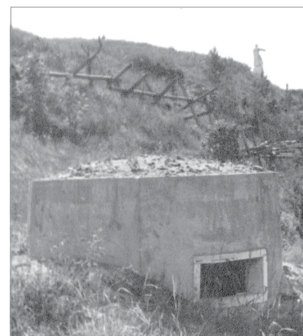
Дзот на берегу Свири