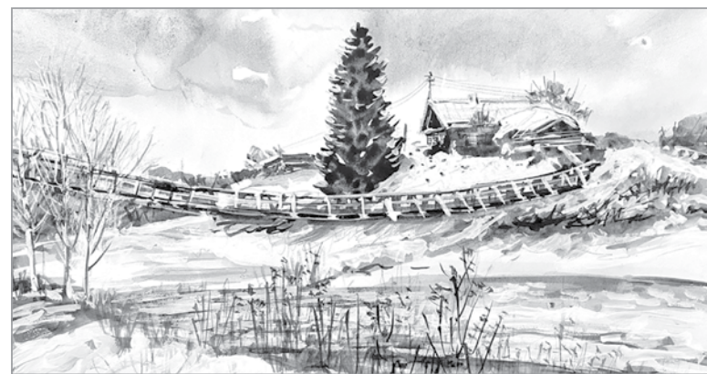
На Ояти. Рисунок Янины Дук